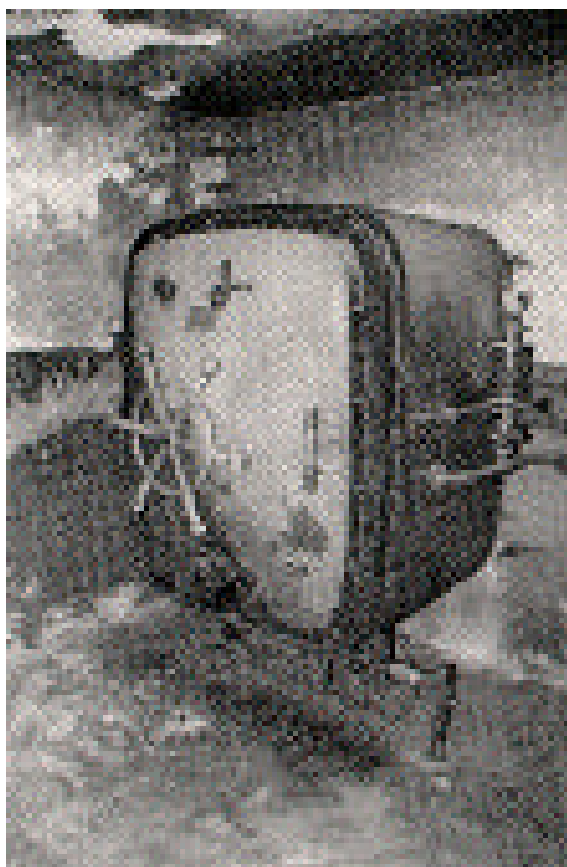
Немецкая камера для дезинфекции одежды, которая использовала синильную кислоту (гранулы «Циклон Б»). Этот метод дезинфекции одежды и казарм использовался армиями Западно-Европейских стран с начала века.